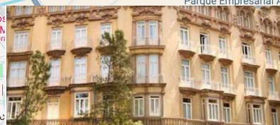
Gran Hotel Albacete